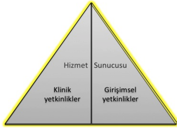
Şekil 2- TUKMOS yedinci temel yetkinlik alanı: Hizmet Sunucusu

Klinik ve girişimsel yetkinlikler edinilirken ve uygulanırken Temel Yetkinlik alanlarında belirtilen diğer yetkinliklerle uyum içinde olmalı ve uzmanlığa özel klinik karar süreçlerini kolaylaştırmalıdır.