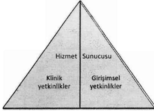
Şekil 2- TUKMOS yedinci temel yetkinlik alanı: Hizmet Sunucusu

Klinik ve girişimsel yetkinlikler edinilirken ve uygulanırken Temel Yetkinlik alanlarında belirtilen diğer yetkinliklerle uyum içinde olmalı ve uzmanlığa özel klinik karar süreçlerini kolaylaştırmalıdır.